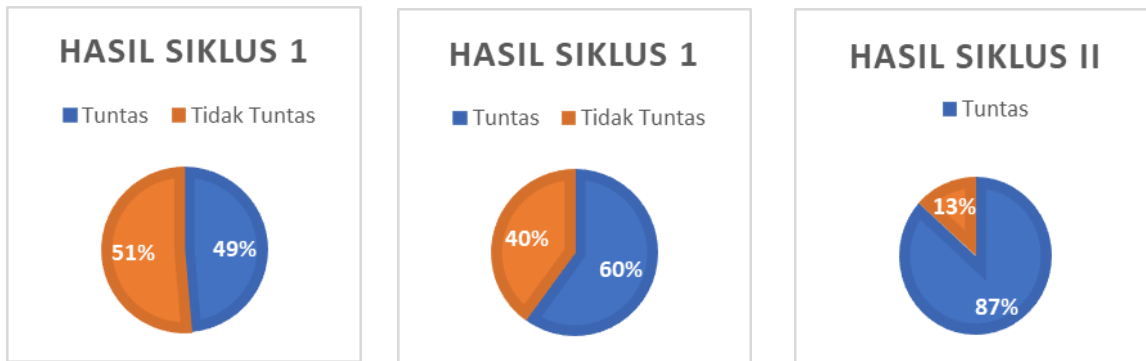
Gambar.2.1 Hasil Siklus I,II